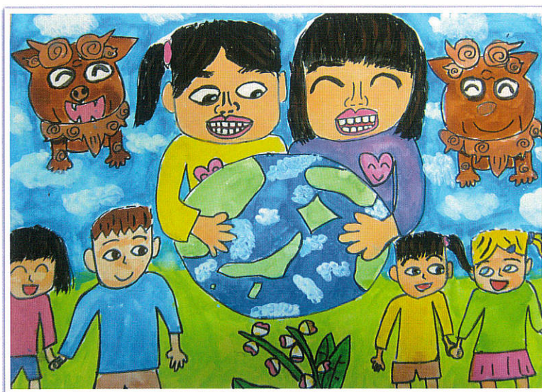
平和な空 安里 結 (美里小)